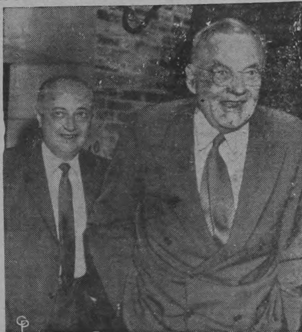
El Secretario de Estado John Foster Dulles sale de su casa en Washington con el ministro del exterior francés Christian Pineau después de una conferencia sobre la situación de Siria.