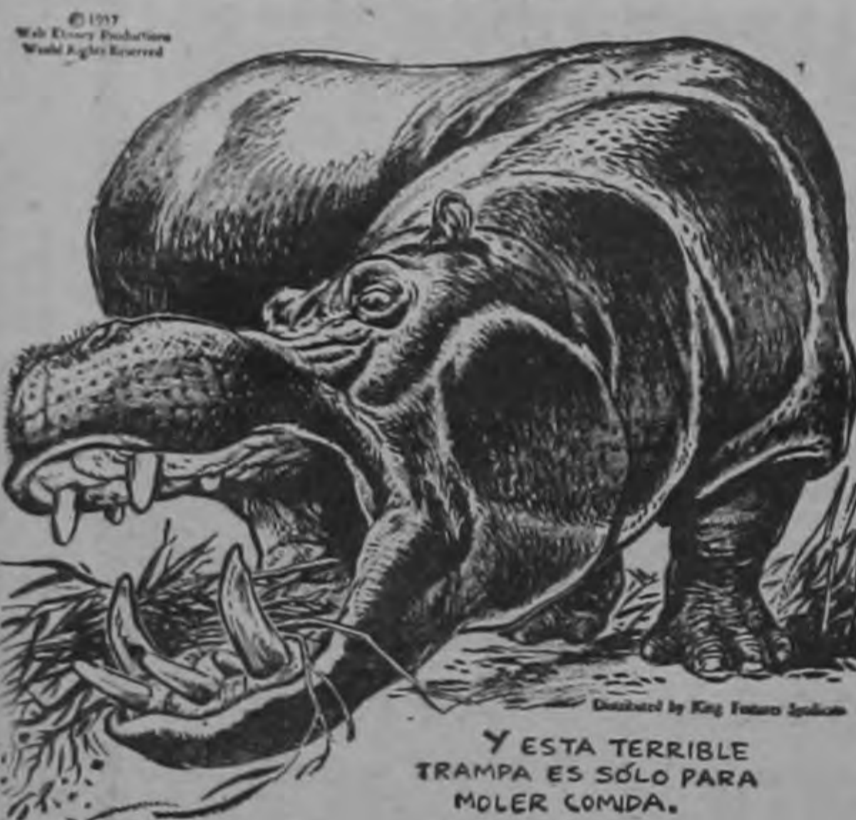
Y ESTA TERRIBLE TRAMPA ES SÓLO PARA MOLER COMIDA.

EL MAMÍFERO DE BOCA MÁS GRANDE ES SIN DUDA EL HIPOPÓTAMO. ALGUNOS DE SUS VARIADOS SOBREDIENTES PESAN HASTA 7 LIBRAS... Y ALCANZAN UNA LONGITUD DE DOS PIES Y MEDIO.